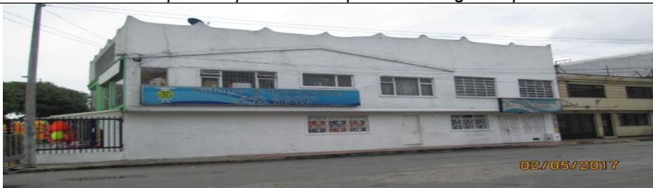
Fotografía No. 2 Vista de más de un aviso por fachada y los cuales no cuentan con registro de Publicidad Exterior Visual ubicado en la Avenida Carrera 30 No. 1 F - 40